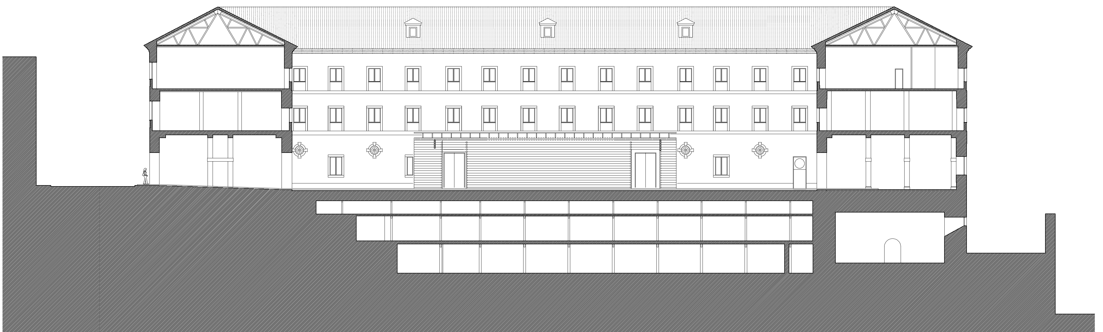
SECCIÓN LONGITUDINAL LANGSSCHNITT M 1/200